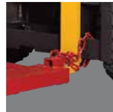
Fixing Bevestiging Befestigung Mecanismo de fijación