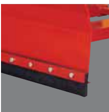
Removable scraper blades Demontabele schuiflijsten Demontierbare Schubränder Rascadores desmontables