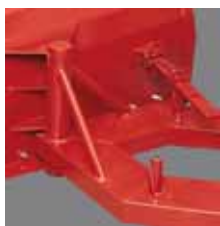
Angular adjustment Hoekverstelling Winkeleinstellung Ajuste de ángulo