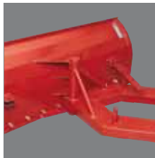
Scraper blade adjustable Schuifblad verstelbaar Verstellbarer Planierschild Hoja rascadora ajustable