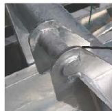
Optioneel: HD beugel.

De gecertificeerde kraancontainer Type A 1000ltr 2000kg geeft de kraanmachinist de mogelijkheid het lossen alleen te verrichten. De kraancontainer is toepasbaar voor diverse soorten kranen en/of andere hef/hijs machines voorzien van hijsketting.