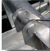
Optioneel: HD beugel.

De gecertificeerde kraancontainer Type B 1000ltr 2000kg geeft de kraanmachinist de mogelijkheid het lossen alleen te verrichten. De kraancontainer is toepasbaar voor diverse soorten kranen en/of andere hef/hijs machines voorzien van hijsketting.